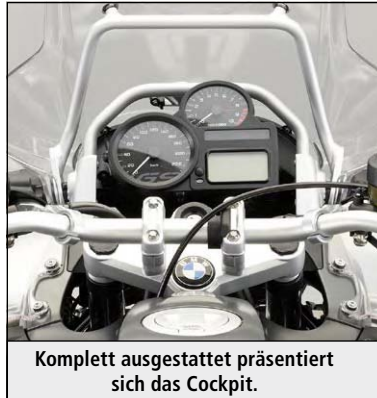
Komplett ausgestattet präsentiert sich das Cockpit.