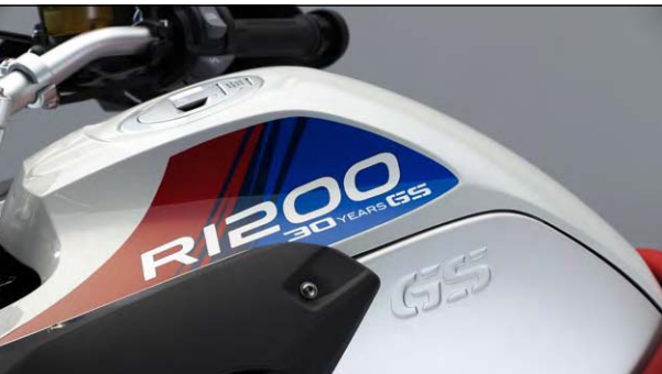
Zum 30sten GS-Geburtstag spendiert BMW eine sportlich weisblaurot Gewandete!