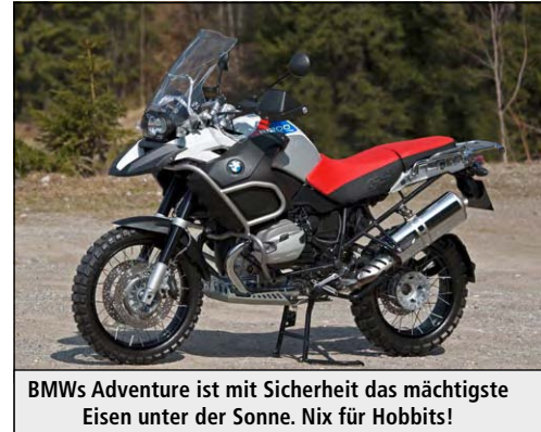
BMW's Adventure ist mit Sicherheit das mächtigste Eisen unter der Sonne. Nix für Hobbits!